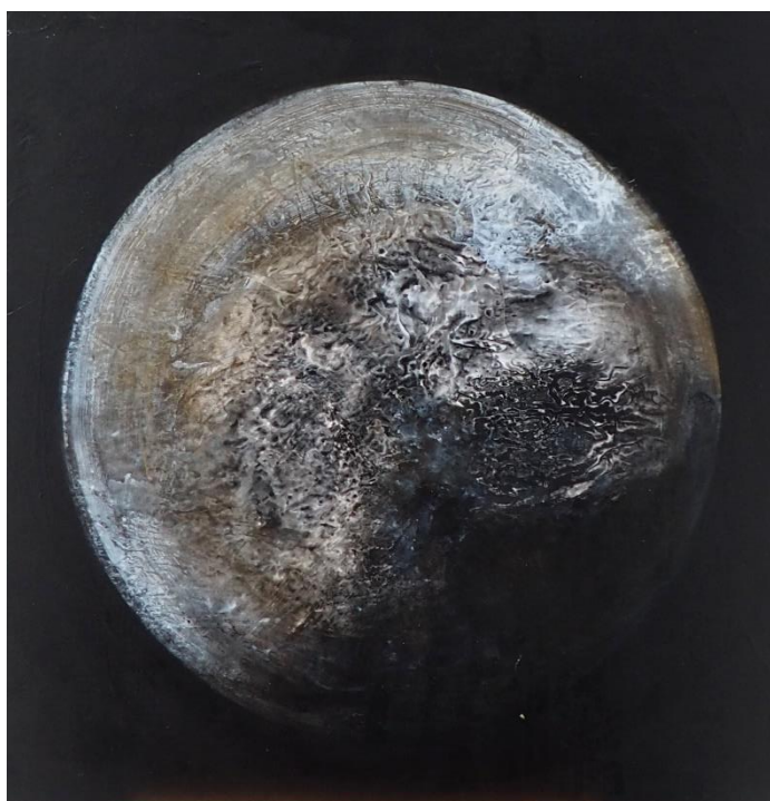
Un autre monde