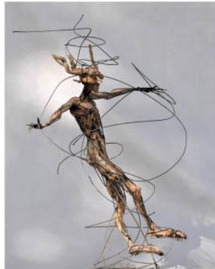
Bruno Lemée Personnage aux lassos

Ouverte au public tous les jours de 14h à 18h vendredi nocturne de 18h à 20h