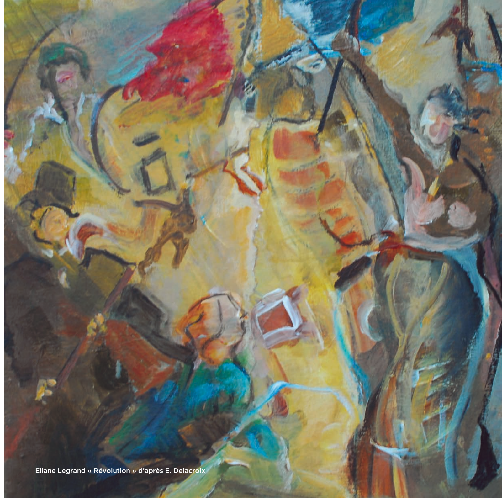
Eliane Legrand « Révolution » d'après E. Delacroix