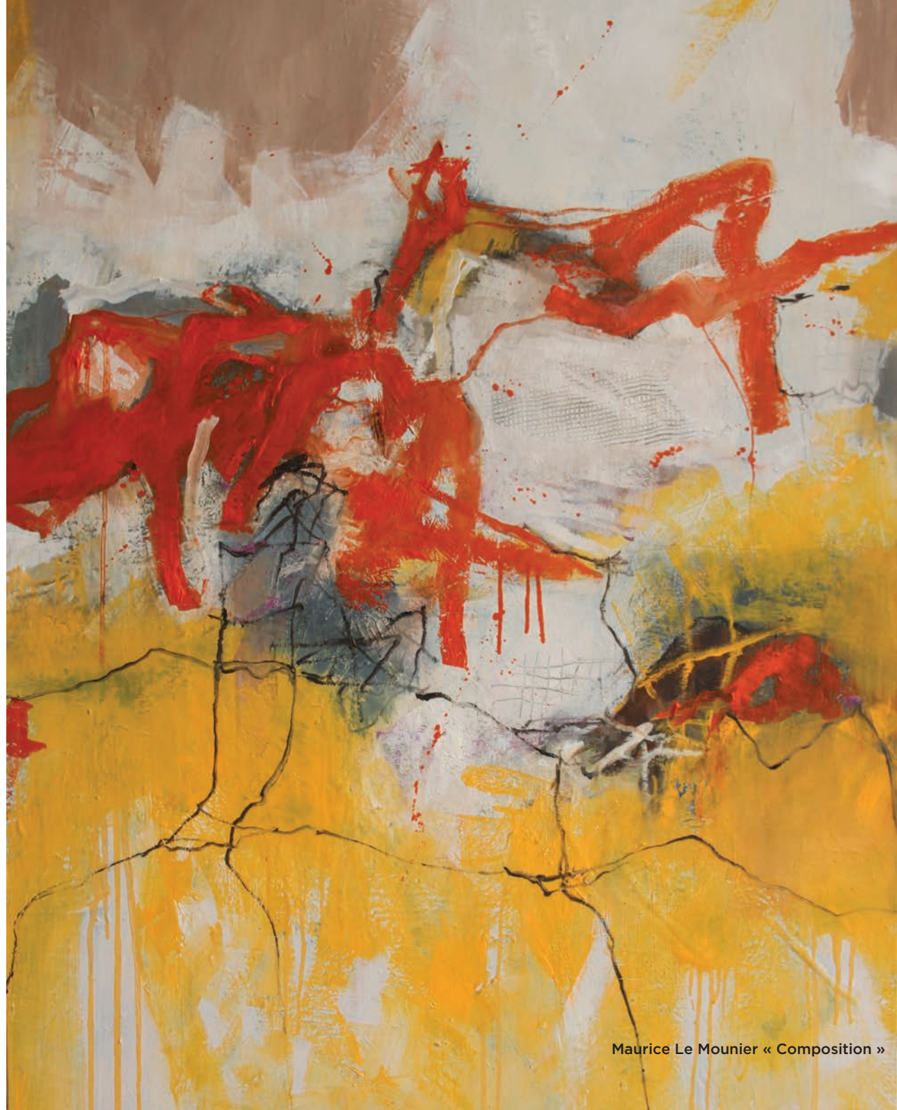
Maurice Le Mounier « Composition »