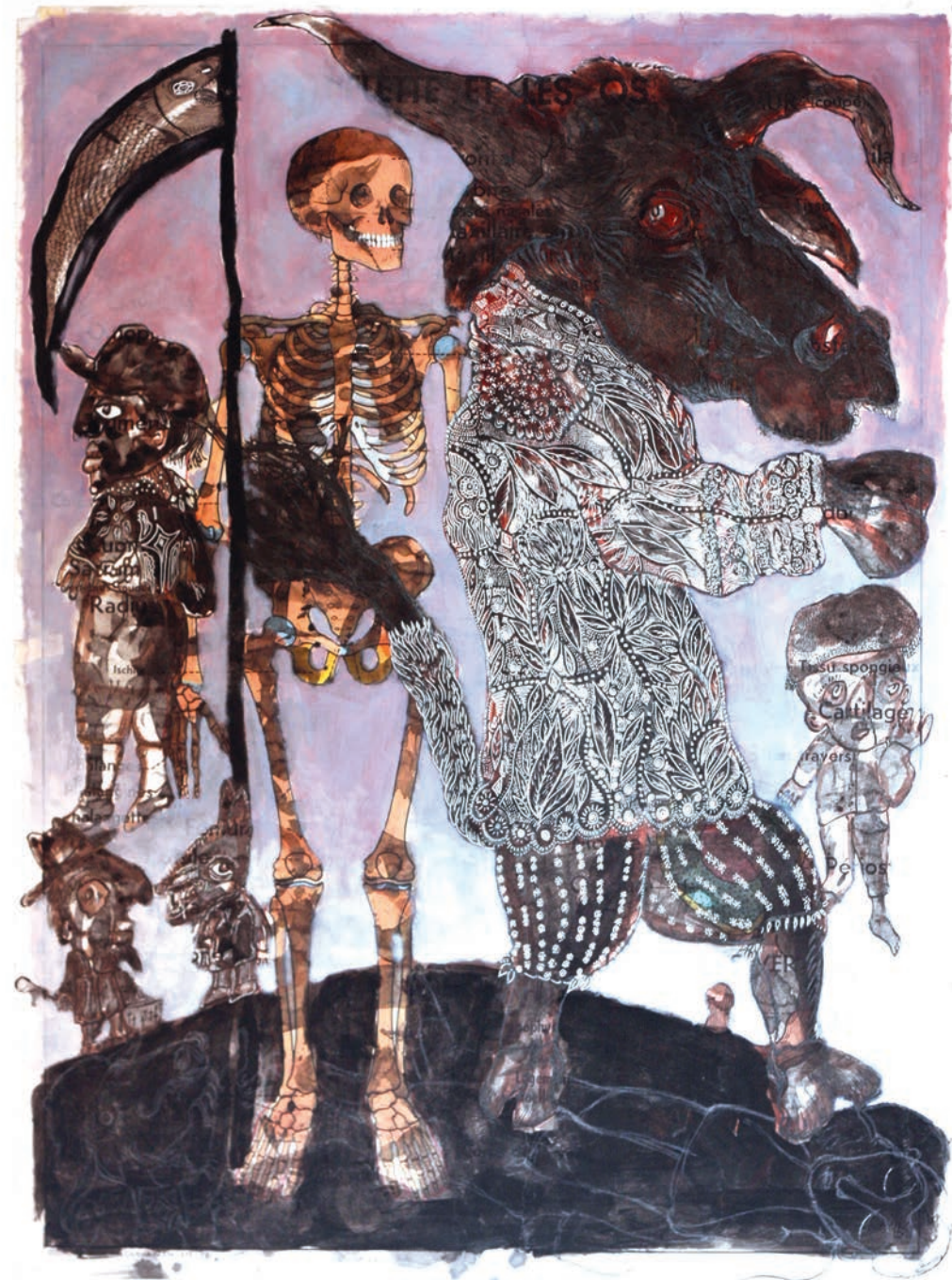
Raphaël Mallon « La mort du Torero »