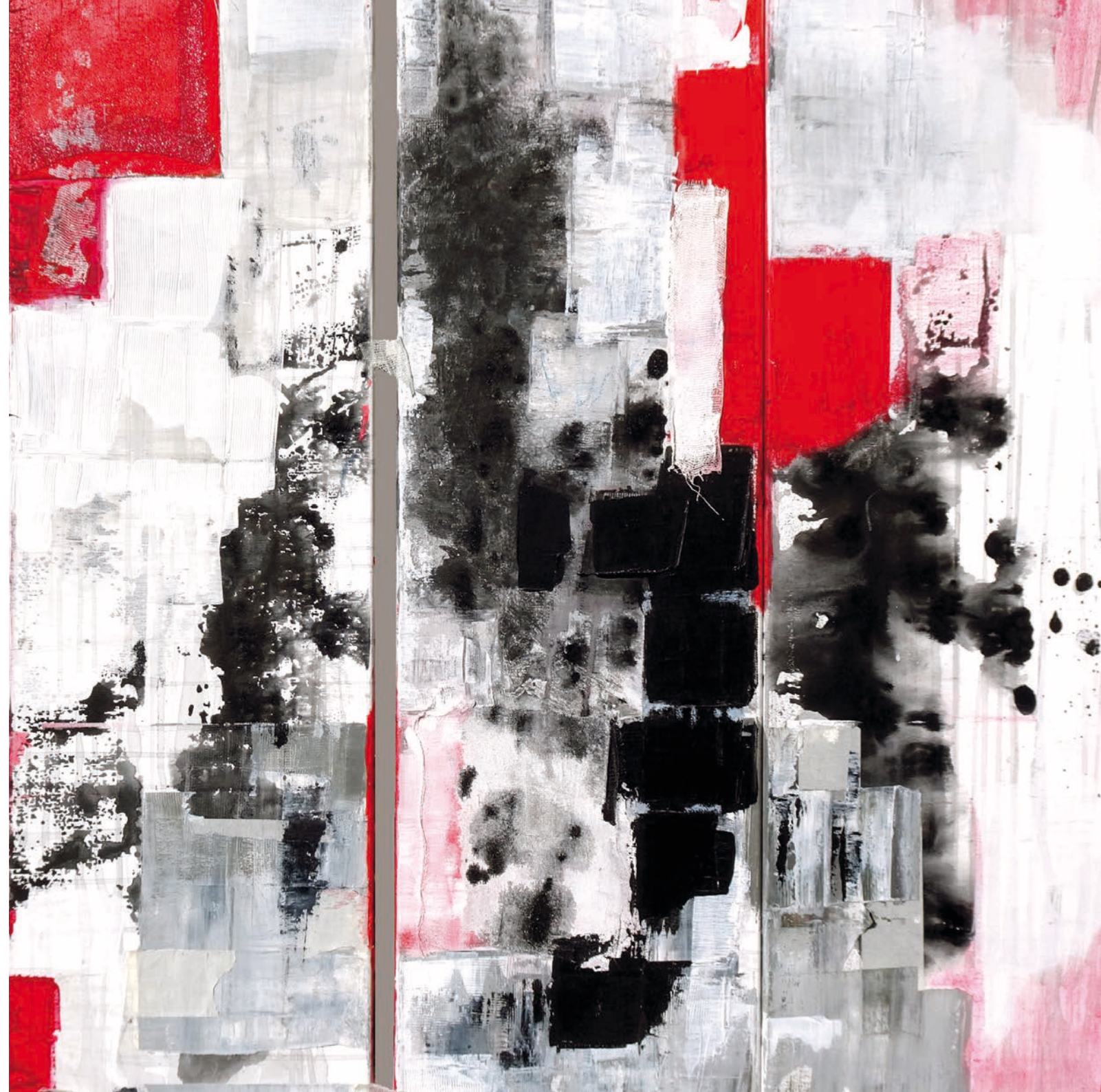
France Quenelle « Rouge, blanc, noir »