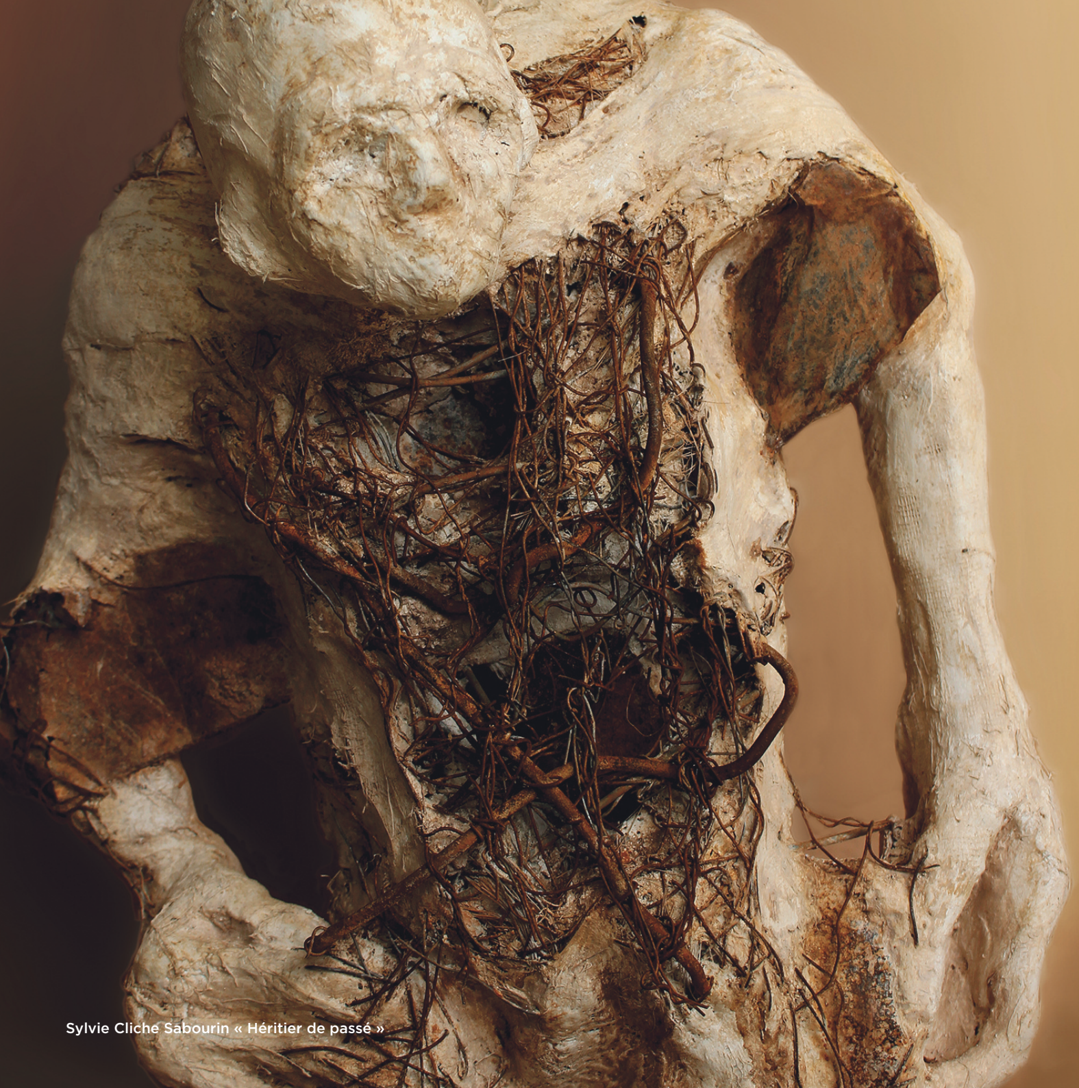
Sylvie Cliche Sabourin « Héritier de passé »

ROVERSI Annick 95120 ERMONT 06 60 43 50 21 annick.roversi@orange.fr