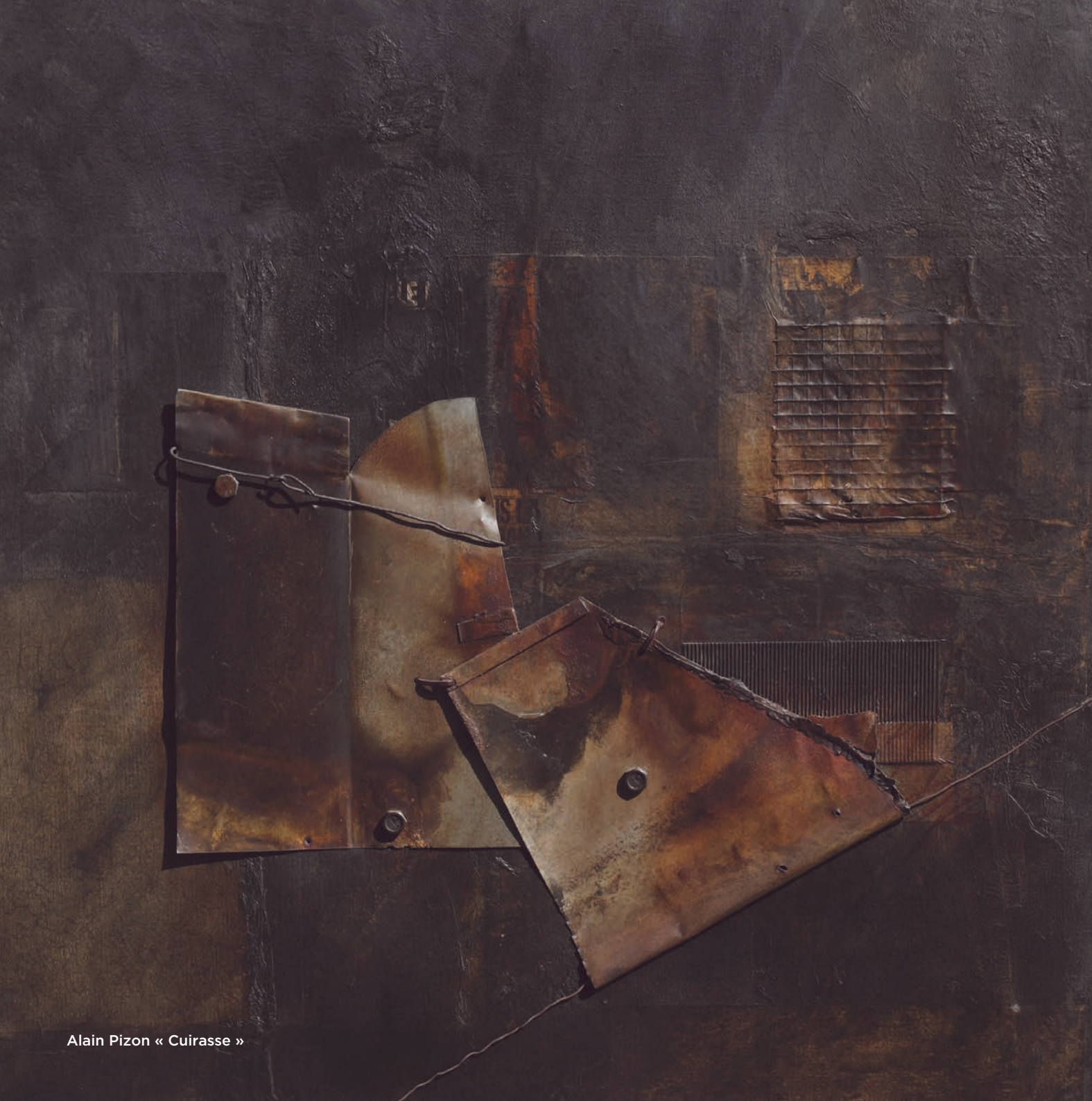
Alain Pizon « Cuirasse »