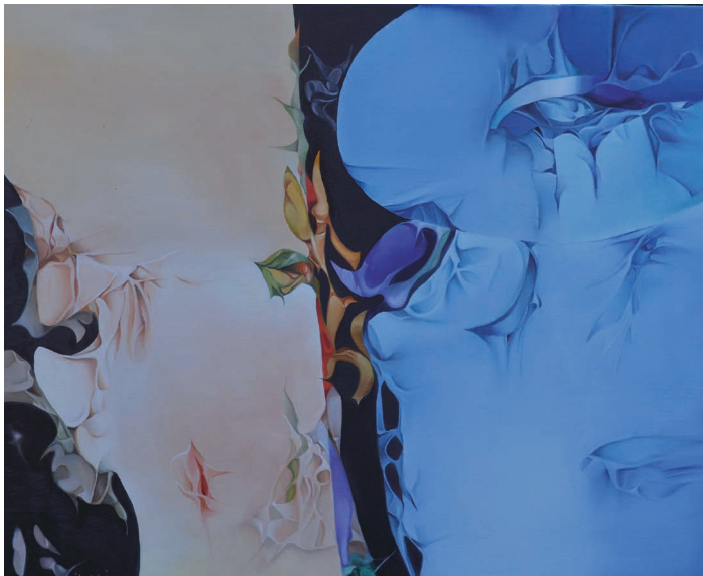
Jean Gounin « Tes déchirures plurielles »