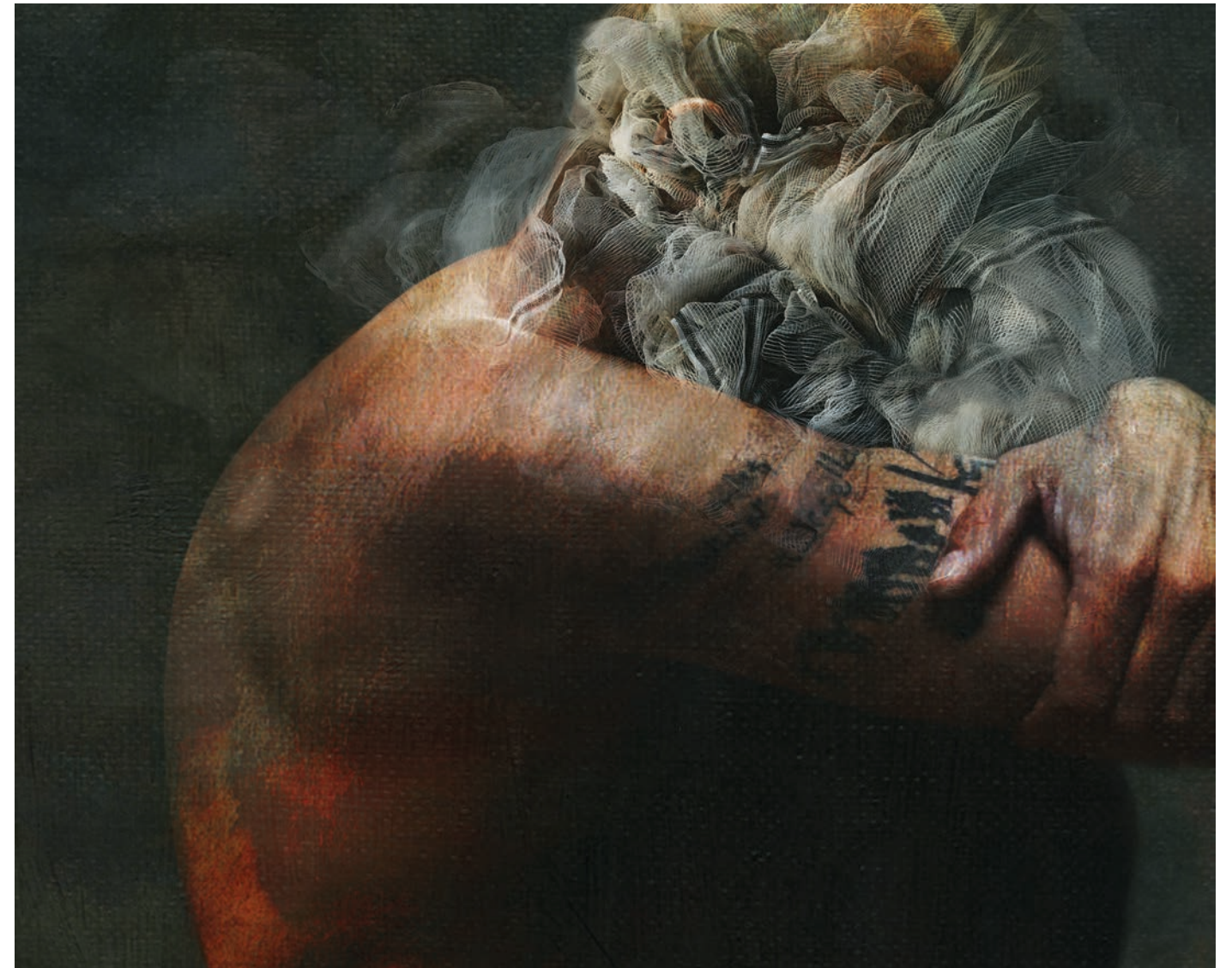
Isabelle Cochereau « Anathème » 50x40 cm

Performances sur palissades - Ville en Fête - Montreuil