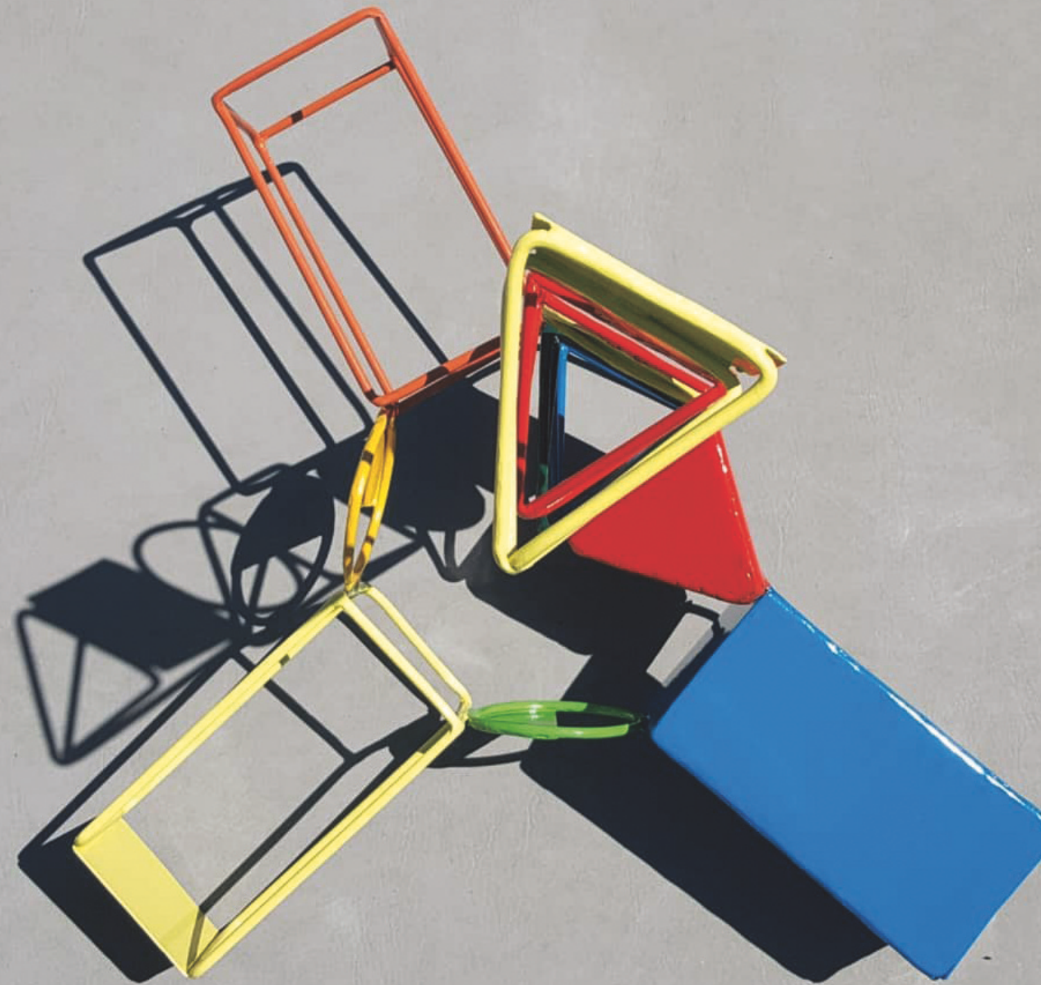
Etienne Frouin « Hommage »