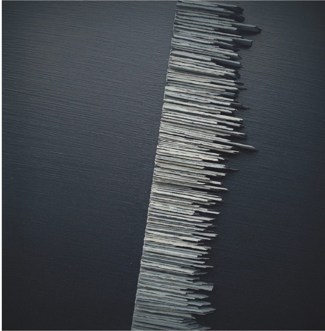
Sezny Peron « Souffle court »