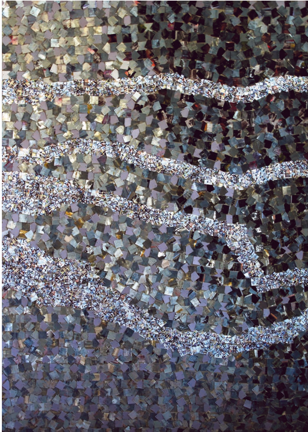
Pascale Chauvel « Minéral »